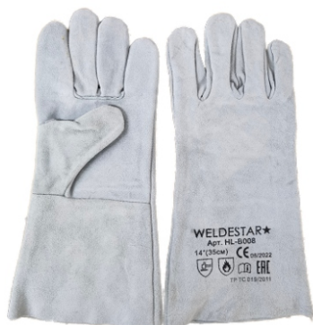
Краги спилковые WS