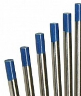
Вольфрамовые электроды WS