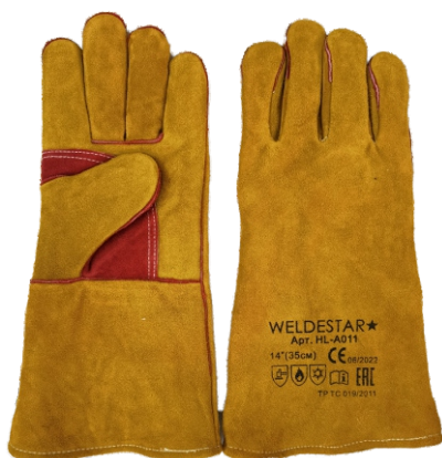
Краги спилковые WS