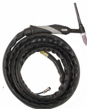
Горелка аргоновая TIG WS 26