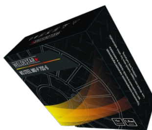
Проволока полированная WS Steel MIG-P 70S-6