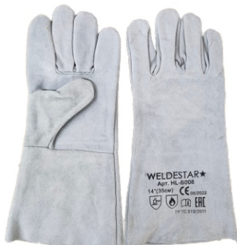
Краги спилковые WS