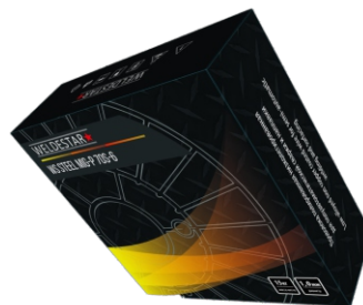
Проволока полированная WS Steel MIG-P 70S-6