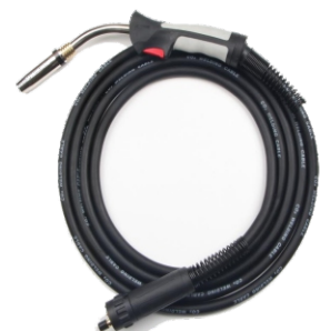
Горелка WS 36